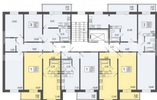
ТИПОВОЙ ЭТАЖ (1-2-3-4 секции)