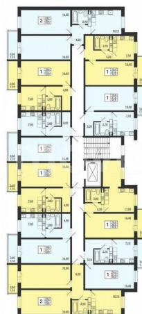
ТИПОВОЙ ЭТАЖ (5 секция)